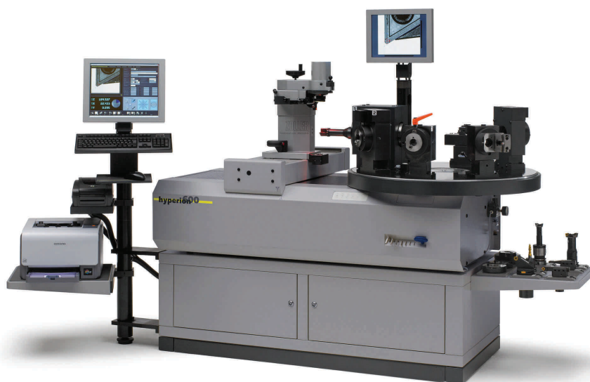
Měřicí a seřizovací přístroj ZOLLER »hyperion 600« s revolverovým stolem Ø 745 mm